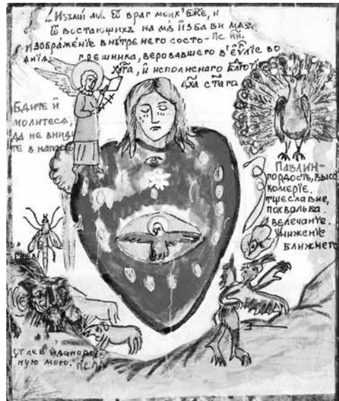
Ил. 4. Внутреннее состояние грешника, уверовавшего уже во Христа и Евангелие, исполненного благодатью Духа Святого. Фрагмент настенного листа Fig. 4. The Inner State of a Sinner Who Already Believes in Christ and the Gospel, Filled with the Grace of the Holy Spirit. Fragment of a wall sheet

Далее изображается внутреннее состояние грешника, кающегося и начинающего «удалиться от греховъ и внутреннего состояния грешника, веровавшего во Христа и исполненного благодатью для Святого духа». Внизу — изображение сердца человека, который после своего обращения к Богу предается греху и попадает во власть дьявола. Визуальное повествование заканчивается изображением смерти нечестивого и воздания за грехи и смертью праведного и благочестивого христианина. В картинке с изображением усопшего праведника сюжет расширен — вводится иннок с крестом у изголовья: так художник извещает об упокоении в скитах. Внизу картинке — цитата из стихотворения А. В. Кольцова «Последняя борьба»,