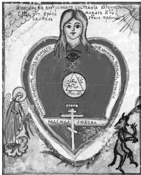
Ил. 3. Внутреннее состояние благочестиваго. Сердце его храмъ живаго Бога, обитель Святыя Троицы. Фрагмент настенного листа

Справа — четыре «сердца праведных» в красных рамках. Автор лубка начинает конструировать образ праведной жизни с изображения внутреннего состояния человека, «что до конца своей жизни боролся со грехом и повизая в благочестии».