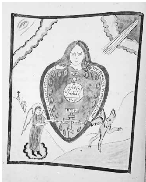
Ил. 2. Внутреннее состояние благочестиваго. Сердце его храмъ живаго Бога, обитель Святыя Троицы. Иллюстрация к рукописи. Л. 34