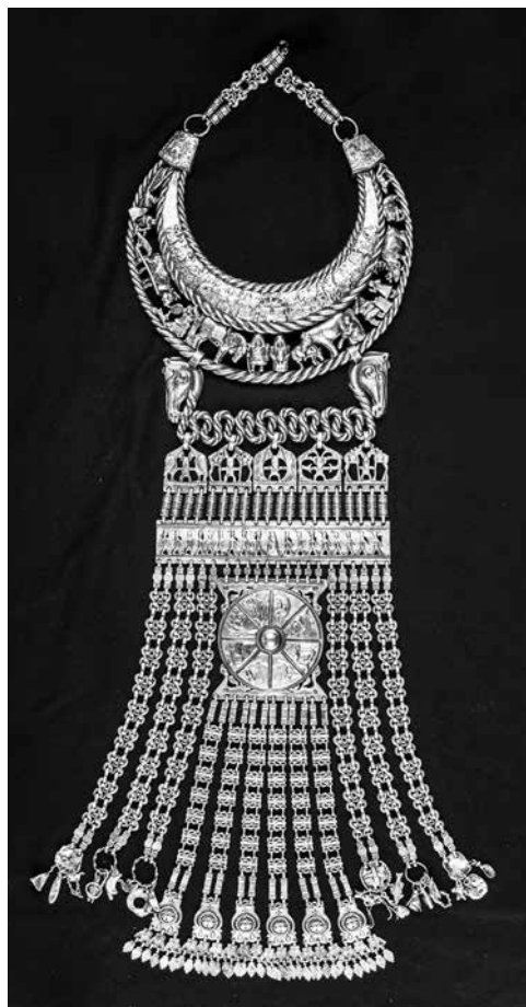
Илл. 2. А. В. Манжурьев. Ювелирная композиция «Аан Алахчын Хотун» («Дух Хозяйки Земли»). Серебро. 2018 г.