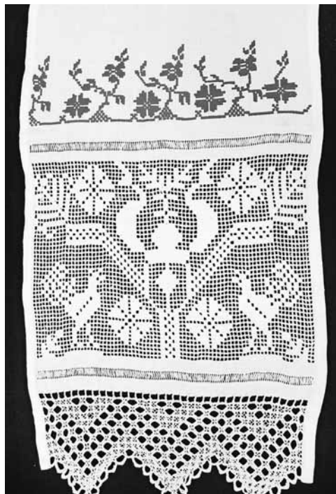
Фото 3. Полотенце из д. Явидово, Торжокский р-н, Тверская обл. (фотоархив автора)