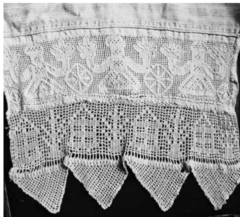
Фото 1. Полотенце из д. Игнатьево, Торжокский р-н, Тверская обл.

Еще более поразительное сходство с внешним видом «предвестницы» из с. Себрово демонстрирует образ на полотенце из д. Явидово Торжокского района (фото 3). Центральная фигура призвана передать архаичное представление о женском порождающем божестве, воплощенном в виде столбообразного идола. В пользу того, что это изображение кумира, божества, свидетельствуют окружающие его звезды, центральное и доминирующее положение на конце полотенца, а также его идолоподобность. Женская ипостась божества