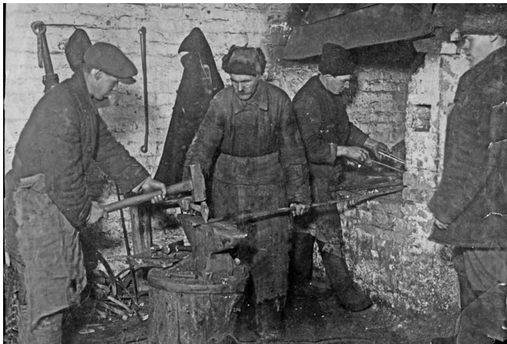
Рис. 2. Кузница в с. Коломенском. 1931 г. Фото из коллекции МГОМЗ

Smithery. Village Kolomenskoye. 1931. The collection of Moscow State Integrated Art and Historical Architectural and Natural Landscape Museum-Reserve