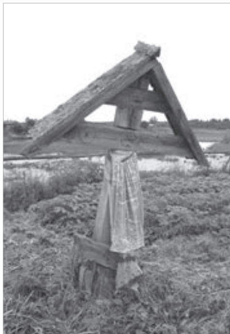
Фото 2. Обетный крест (С). 2008 г.