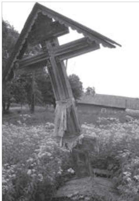
Фото 1. Обетный крест (А). 2008 г.

Женские просьбы, моления нередко скреплялись обетом и принесением дара. У крестов оставляли тканевые предметы, созданные руками женщин (пелены с вышитыми или накладными крестами, предметы одежды): «[эти кресты. — Е. С.] чисто-чисто староверские. Уже обветшали. В этом году что-то никто не стали [подновлять. — Е. С.], а так приносили [пелены. — Е. С.]». Если в семье под одной крышей проживало несколько женщин, «[пелену готовила. — Е. С.] старшая в семье по чину, которые уже действительно