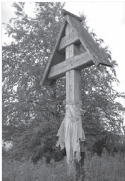
Фото 3. Обетный крест. Сакральный комплекс «Кресты». 2008 г.

Обычай засевать крупой и выливать спиртное по обоим бортам лодки тоже недавний и, возможно, был перенесен из обрядов поминовения умерших, совершаемых на кладбище (сходные действия совершаются сельскими жителями в дни поминок у Большого креста