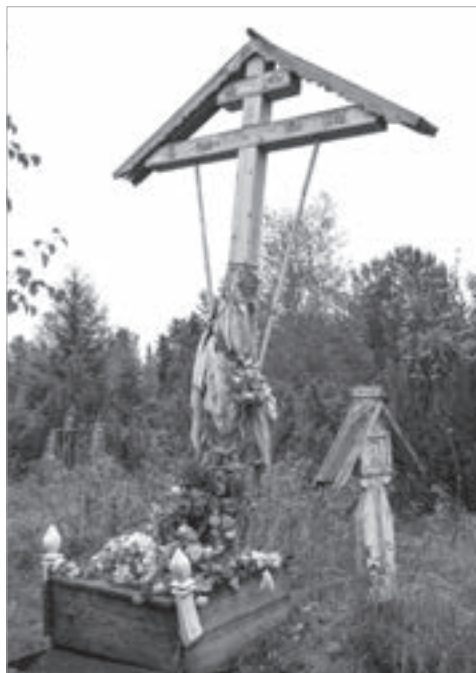
Фото 4. Троица. Большой обетно-поминальный крест на кладбище. 2009 г.

Здесь можно помянуть и покоящихся на местном кладбище. Бывает, что по причине непогоды поход к дальним могилам недоступен (как, например, в Радуницу, когда повсюду еще лежит снег). «Кто-то не может попасть, когда еще снегу много. Туда [к дальним могилам]. Сугробы стоят. Идут сюда. Считается, что идут к Большому кресту. Твои даже не здесь похоронены. Вот, можно прийти сюда, положить, что ты уже как поминаешь» (Зап.