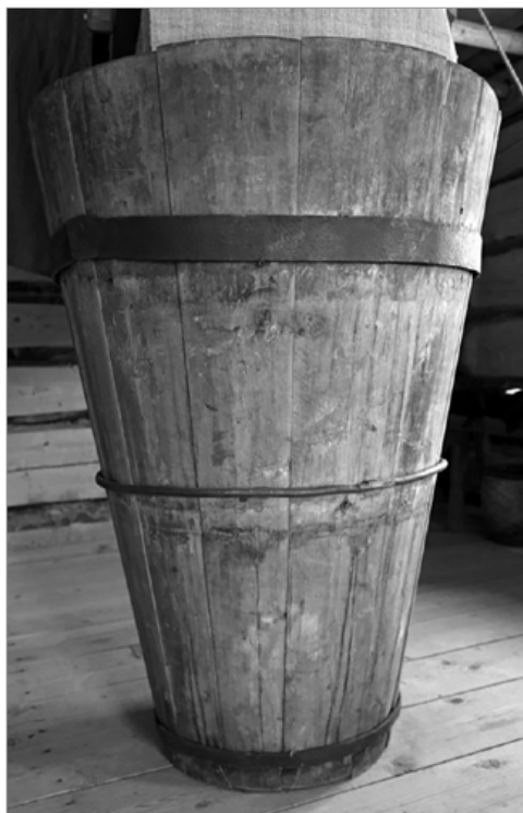
Чан для окрашивания холстов. Начало XX в., д. Дмитриево Юсьвинского МО. Из фондов Пермского краеведческого музея A vat for painting canvases. Beg. of the XX cent., Dmitriev vil., Yusvinsky municipal dist. From the funds of Komi-Permyak Local Lore Museum

Самым распространенным в XIX в. был краситель индиго (индик), получаемый из сушеного и перебродившего сока растения indigofera . В России его называли кубовой краской или кубом [Там же, 75]. С конца XIX — начала XX в. натуральный краситель вытесняет его синтетический аналог. Термин кубовый и кубы был известен и в Прикамье, он использовался как для названия чана для окраски, так и собственно синего цвета и окрашивания в него. Известен он и в коми-пермяцком языке: « Дора краситвисё кубын дубассэзвё. Карповё нёбётвисё краситны » (Холст красили на дубасы кубом. В Карпово (с. Архангельское) носили красить) (д. Архипова, Кудымкарский МО); « Синий холст кубён мичётём, кубён краситём » (Синий холст кубом красили, кубом красили) (д. Важ-Пальник, Кудымкарский МО); « Мичётвисё. Купечезвён вди краска, сйё мичётёны, куббезё суйёны, печатайтёны дубассэсё. Колё, дак чернитасё, сьёддё керасё » (Красили. У купцов краска была, суют в кубы, печатают дубас. Нужно, так чернят, черным сделают) (с. Ошиб, Кудымкарский МО).