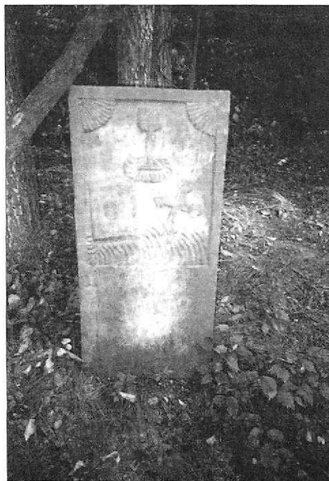
Могильная плита на старом казачьем кладбище ст-цы Елизаветинской Азовского р-на.