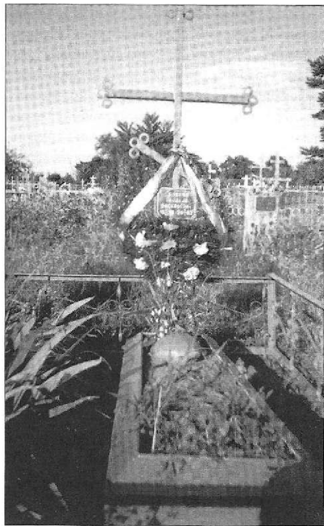
Крест на женской могиле, перевязанный головным платком. Ст-ца Голубинская Калачевского р-на Волгоградской обл. 2004 г. МДЭ РГУ.

водом в пользу сохранения традиции служит желание доставить своей смерти как можно меньше хлопот родным и близким.