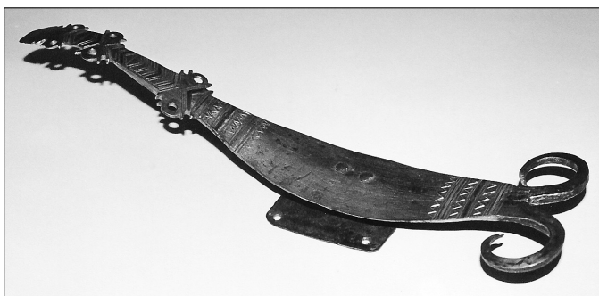
Фото 1. Крюк для удержания вожжи. Ковка, резьба, гравировка, инкрустация. Таймырский краеведческий музей, № 5989(2). Фото автора

самой птицы гагары — «гагарки» в местном варианте произношения. Подтверждением этому может служить четкая орноморфная форма предмета, стилистическое сходство с подобными шаманскими изображениями. Слово, как и многие другие, видимо, перешло из бытовой лексики русских старожилов. В старинных говорах