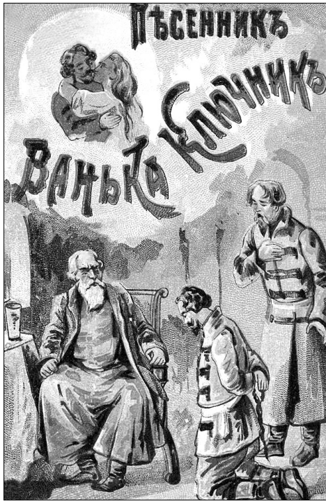
Ванька-ключник: сборник новейших песен и романсов. СПб., 1900. РГБ

вариантах. Следует заметить, что в данном случае песня уже воспринимается как народная, да и три строфы, приводимые далее в картинах, дословно совпадают с лубочным текстом и текстом песенников, а не с авторской версией. Эта экранизация не была единственной. «Ванька-ключник» переносился на экраны трижды — в 1909 г. и дважды в 1916 г. [Вишневский 1945].