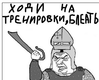
Илл. 3б. Вариант использования визуального мема «Будь мужчиной» [VK 2010]

Однако таких текстов мало. Даже те тексты, которые, казалось бы, завоевали интернет-пространство, крайне редко попадают в устное обращение. За десять лет включенного наблюдения нам единственный раз удалось зафиксировать устное распространение пародийных частушек, созданных в Интернете, молодыми «викингами» на фестивале «Русборг» в мае 2007 г. Приведем самый известный из этих текстов: