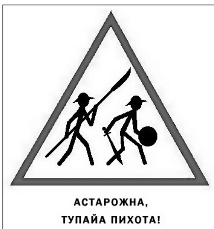
Илл. 3а. Вариант использования мема «Упячка» [Li 2007]