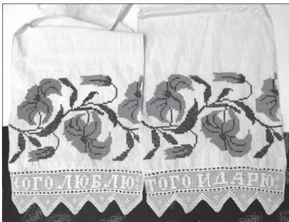
Фото 4. Полотенце, пос. Красная Горбатка, 2007. Снято в музее Центра внешкольной работы

деревне есть так называемая комната ремесел, где хранятся предметы, которые смогли собрать местные краеведы, работники клубов, библиотек и т. д. Во многом благодаря этому мы можем видеть те немногие интересные образцы, которые сохранились на местах. Однако чаще всего подобные собрания не отличаются аккуратностью фиксации материала, поэтому грамотным коллекционированием это явление назвать пока еще трудно. Тем не менее, даже по таким фрагментарным и в какой-то степени случайным собраниям можно уверенно говорить о разнообразии ассортимента текстильных предметов, а также о богатстве их декора в данном регионе.