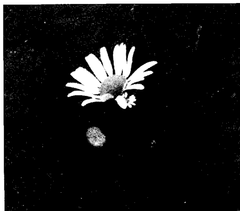
«Пирожное» из глины. Д. Жувам Юкаменского р-на УР. 2004 г.

Современную детскую деревенскую среду удмуртов по-прежнему отличает хорошее знание дикорастущих трав. Многие из них служат детям не только материалом для игры, но и являются лакомством. Это листья и стебли аниса, крапивы, горькой редьки, щавеля, сныти. Они входят в число «блюд» во время игры «в гости», «в дом», «в свадьбу». Если многие растения имели функцию условной еды, то съедобные употребляли по назначению. Именно с ними «варили» суп, «пекли» пироги, поскольку это были травы, которые и сейчас применяются в народной кухне. Использование в игре растений культурной и дикорастущей флоры показывает, что дети не только знают, как надо их применять, но и владеют терминологией, осведомлены о сроках и месте сбора. Обычно с ними перестают играть, едва заканчивается сезон сбора, и заменяют другими растениями и ягодами.