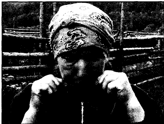
Свистулька из травы турун шулан. Д. Ворца Ярского р-на УР. 2004 г.

Детские игры со свистулками были сопряжены с некоторыми пространственно-временными запретами. Например, не разрешалось свистеть в поле и в лесу во время летнего солнцестояния и сенокоса. Запрет был связан с представлением, что свист и шум вызовут непогоду. Детям не позволяли свистеть в избе, полагая, что этим они напугают или рассердят коркакузё («хозяйина дома») – мифологическое существо, охраняющее дом и семью. Специально же просили свистеть, когда хотели вызвать легкий ветер во время веяния зерна или сушки травы. Если же ребенок свистел постоянно, говорили, что он «просвистит свое богатство и счастье».