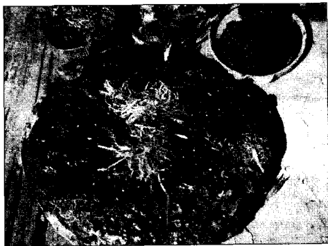
«Торт» из земли, коры, мха и трав. Д. Жувам Юкаменского р-на УР. 2003 г.