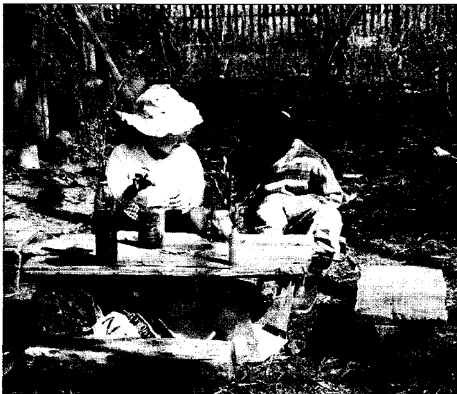
Игра «в дом». Д. Жувам Юкаменского р-на УР. 2003 г.

ла, то иногда выносили туда. Позовем подружек и принимаем их как гостей. Весной как пойдет березовый сок, то березовым соком угощали, как самогоном. Делали всё так, словно принимали гостей » (зап. от А.А. Девятовой, 1941 г.р., с. Бураново Мало-Пургинского р-на УР [ЛАП 2002]). Изготовление «традиционных блюд» и утвари из глины считалось девичьей игрой: « С глиной девочки играли. Делали горинча. Стряпали. Парни не играли с глиной, только кидались » (зап. от Н.И. Байсарова, 1930 г.р., с. Бураново Мало-Пур-