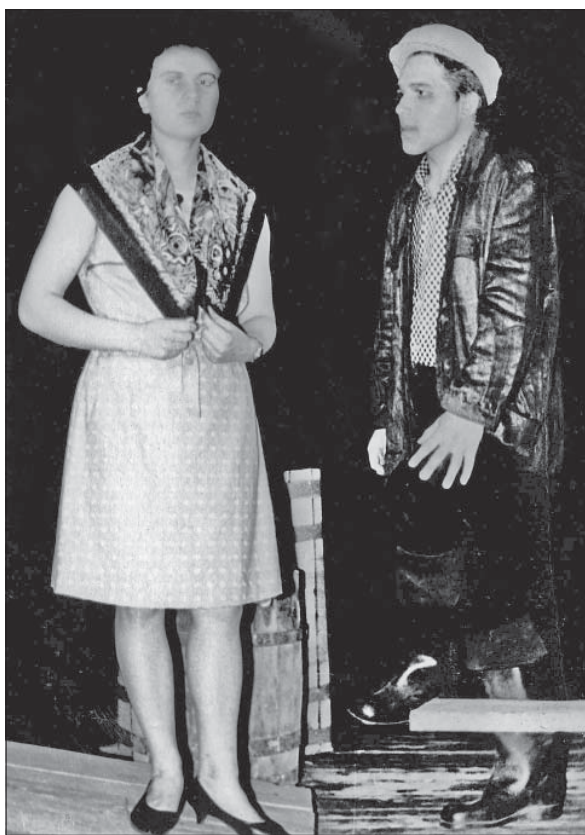
На сцене Ульяновского областного драматического театра, 1966.

Философы считают, что кризисы культуры, какими бы болезненными и глубокими они ни были, являются необходимым условием для ее возрождения и развития: «Когда созидательные силы исчерпаны и все их ограниченные возможности реализованы, соответствующая