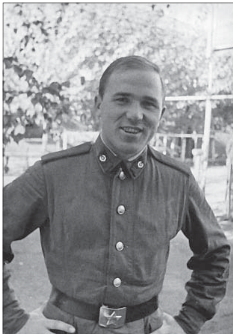
Служба в армии. Тамбов, 1973.

Конечно, этические идеалы прошлых эпох со временем стираются в обыденном сознании людей и общества, а на смену им приходят новые, зачастую бездуховные. Но традиционные формы обладают гибкими ценностными качествами и «коллективной памятью», на основе которых может осуществляться восстановление и обновление культуры общества.