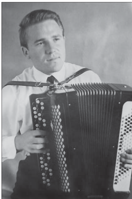
В Московском государственном институте культуры, 1969.