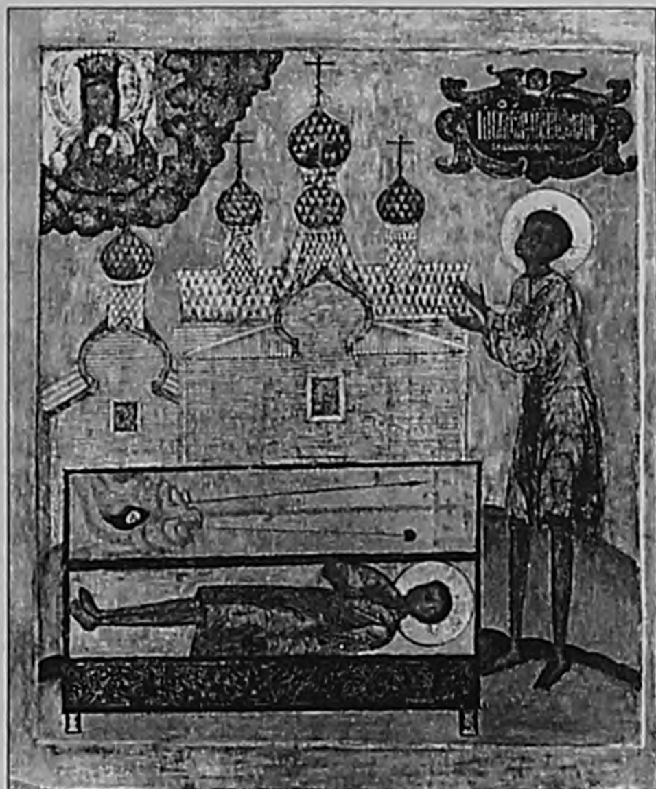
Прокопий Устьянский. Конец XVII — начало XVIII в. 547-држ АОМИИ.

Образы Прокопия Устьянского мы встречаем на Русском Севере и в XIX — начале XX в., хотя ареал их распространения невелик. Культ в основном поддерживался в районе Поважья и в бассейнах рек Устья, Кокшеньги. Населе-