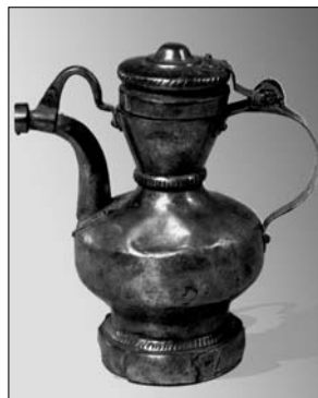
Кумган из частной коллекции

Стопка уложенных друг на друга постельных принадлежностей являлась своеобразным знаком семейного процветания. Чем больше было членов семьи, тем выше была стопка постельных принадлежностей, что являлось показателем благосостояния и здоровья семьи, символизировало продолжение и жизнестойкость родового древа. Занавеска, закрывавшая спальное место молодой пары, — чыбылдык — выделяла интимное пространство для молодоженов до тех пор, пока они не переселялись в собственный дом. Чыбылдык активно использовался в свадебном обряде татар, в частности в некоторых районах существовал обычай перевозить невесту из родительского дома в дом мужа в специальной свадебной повозке, которая покрывалась занавеской чыбылдык [Мухамедова 1972, 168].