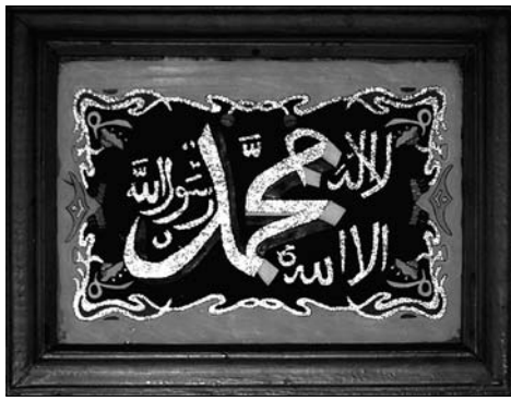
Шамайль. Из фонда отдела этнографии Национального музея Республики Татарстан

ми мастерскими, так и отдельными кустарями. Такой буфет представлял собой деревянный шкафчик с несколько выступающей нижней частью и деревянными двустворчатыми дверками; верхняя часть состояла из ряда полок, которые закрывались деревянными дверцами, иногда со вставленным стеклом. Со второй половины XIX века такие буфеты стали неотъемлемой частью интерьера, в них выставляли красивую фарфоровую посуду и различные безделушки.