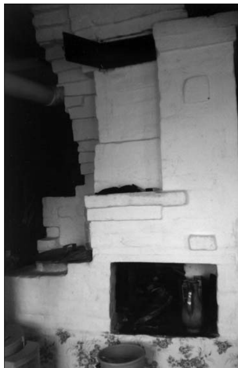
Предметный мир традиционной культуры

Огонь в печи символизирует мужское начало. В загадках о печи огонь ( ут ) — это мужчина, отец: « Анасы юан — ойдэ тора, ата-сы озын — тышта йэри, кызы сылу — ашка йэри » («Мать толстая — дома стоит, отец длинный — на улице ходит, дочь-красавица — в гости кушать ходит»). Соединение огня и печи в зажженном очаге — это соединение мужского и женского начала, что, в свою очередь,