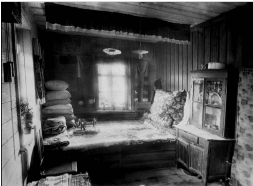
Интерьер парадной половины дома (тур як): сәке, буфет, стул, сундук, текстильное убранство. Арский район Республики Татарстан. 1920-е гг.

принадлежности, книги, развешивали текстильные украшения.