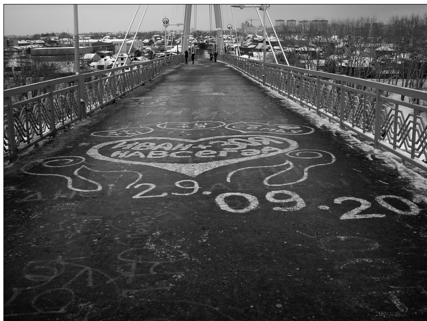
«Свадебное» граффити на Мосту влюбленных. 2012 г.

чительно с влюбленностью и свадебными ритуалами, появился еще один вид граффити — поздравления с днем свадьбы, началом еще не зарегистрированных в официальных структурах отношений, а также их годовщинами. При этом авторами таких надписей, судя по их единому стилю и краске, могут быть как профессиональные организаторы свадеб, так и друзья адресатов надписи. Такие граффити часто очень больших размеров, заключены в сердечко и датированы, изредка украшены художественно.