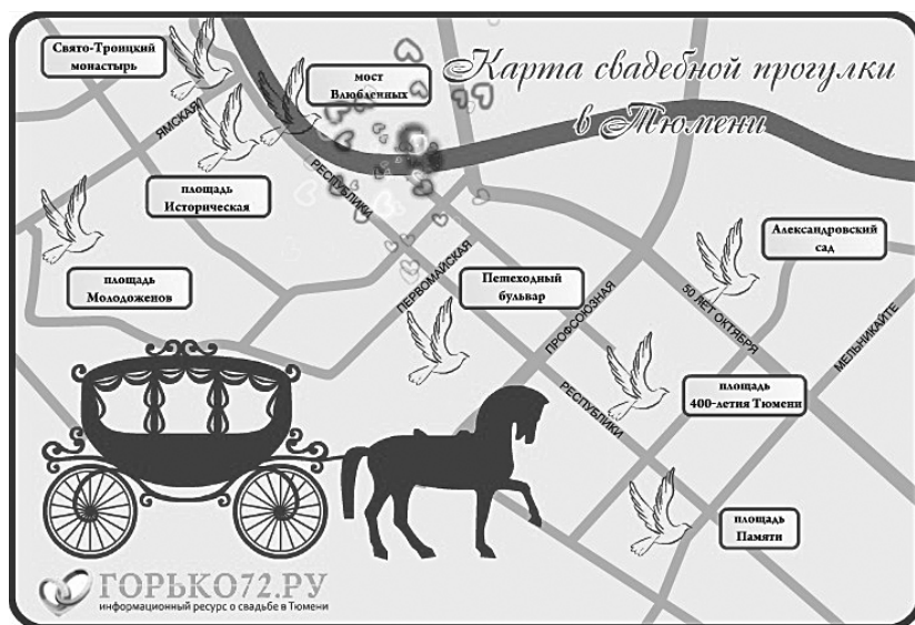
Илл. 1. Карта свадебной прогулки в Тюмени. Брачное агентство «Горько 72. ru» (URL: http://gorko72.ru/pages/34.html )

С другой, восприятие моста как границы не только социальных состояний человека, но и соприкосновение на нем живых и мертвых, или даже столкновение прошлого и настоящего, отражено в таком нарративе, записанном от коренного тюменца: « Было это летом 1997 года, в июле. <...> у меня окна как раз на мост выходят, и он до середины был как на ладони. <...> я мельком глянул на мост и обомлел — на мосту, похоже, была нехилая драка. Ну вроде, чего удивительного? А поразило меня то, что с моста не доносилось ни одного звука драки, хотя ветер дул в мою сторону. Как давно живущий здесь, знаю это по опыту наблюдения, ибо дрались в 1990-е на Пешеходном мосту (Мостом влюблённых он стал весьма недавно) летом довольно часто. <...> Дальше вообще интересная вещь пошла — с моста они кому-то грозились, но явно не мне. Звуков по-прежнему ноль. Пройдя половину расстояния до моста, началось вообще нечто невообразимое — фигуры стали как бы расплываться и частично пропадать. Когда отходил назад — фигуры опять становились плотными. С первыми лучами всё прекратилось» (Зап. от В. Д. У., 1979 г. р., муж., местн., г. Тюмень. 2012 г.).